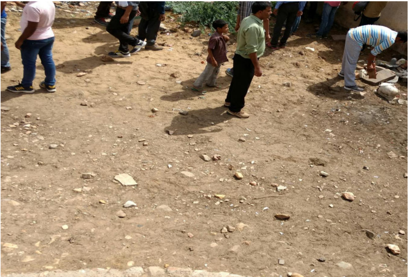
स्वच्छता अभियान के बाद की तस्वीर