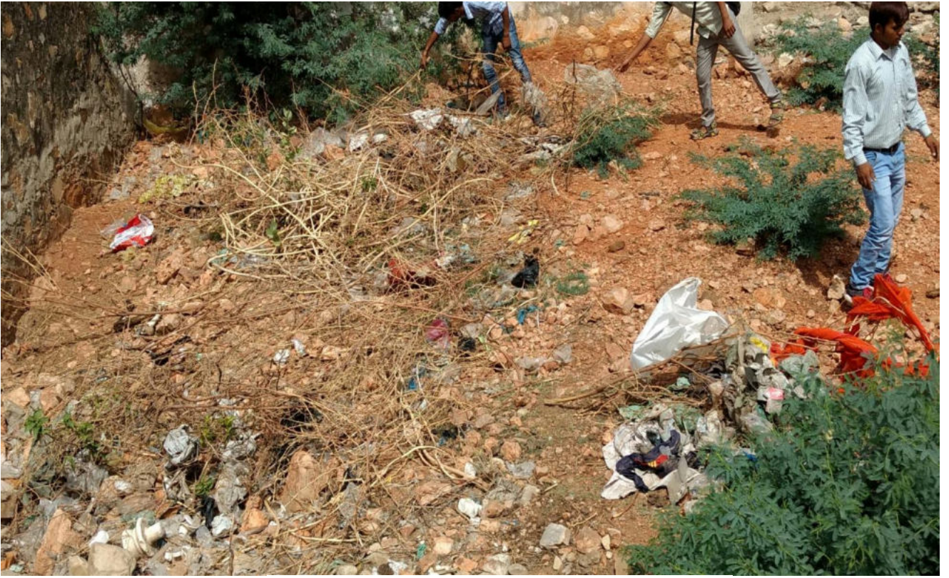
स्वच्छता अभियान के पहले की तस्वीर