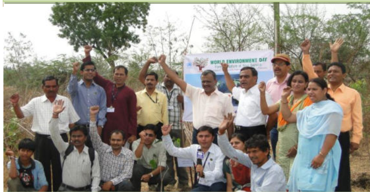
‘जय स्वच्छ परिवेश’