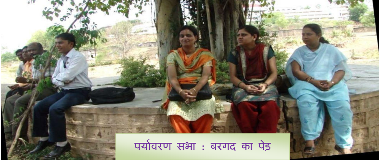
पर्यावरण सभा : बरगद का पेड़