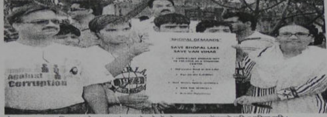
वोट क्लब पर रविवार को उदय संस्था ने लोगों से कचरा न फेंकने की अपील की।

जेसीआई संस्था ने सदस्यों को पीधे वितरित किए और संकल्प लिया कि हर सदस्य उस पीधे की देखभाल करेगा और बढ़ा होने तक उसका