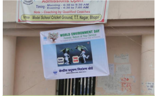
Model Senior Secondary School