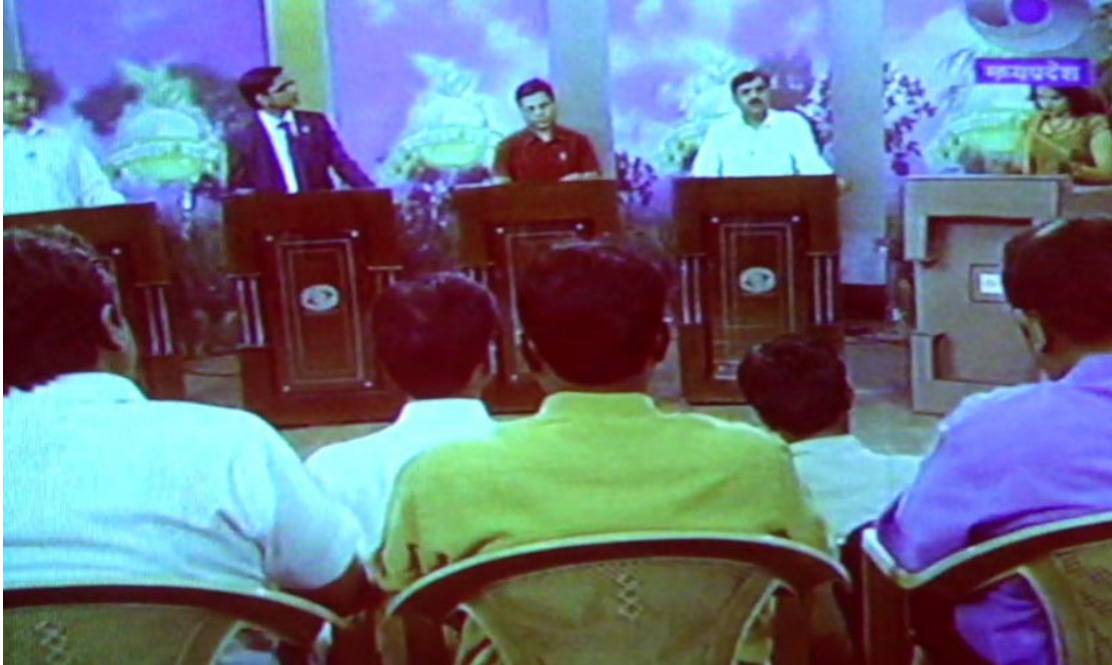
Discussion on Forest & its conservation by selected Environmentalists & Scientists