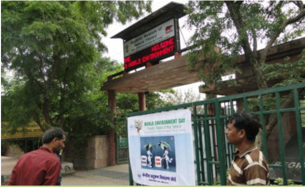
Regional Museum of Natural History (RMNH)