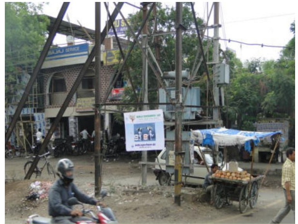
BHEL Jubli Gate