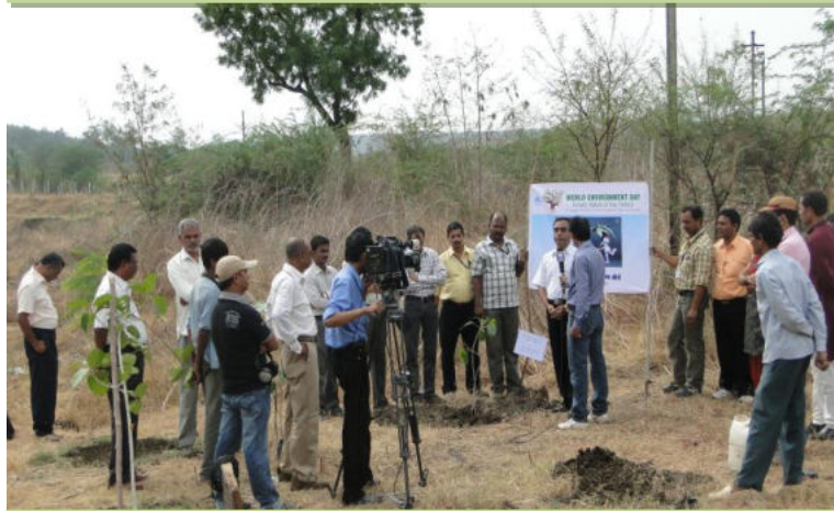
Coverage by DD Madhya Pradesh