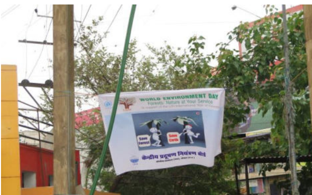
In front of DB Mall (near M.P. Nagar)