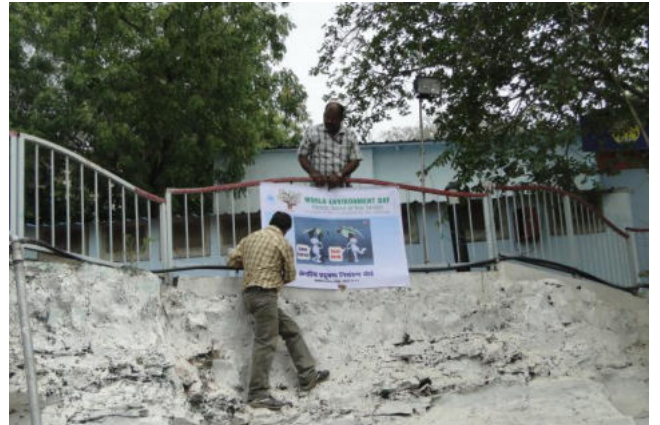
Upper Lake (Most popular place of Bhopal City)