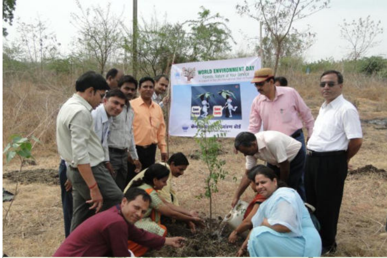
Plantation @ Smiriti Van