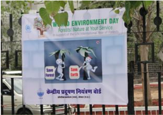
Doordarshan Madhya Pradesh