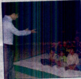
Children taking part in the quiz competition.

Ahead of this, an awareness programme was organised wherein the people were informed about the alternative resources of energy. Under the 'Dance for environment', the pub-