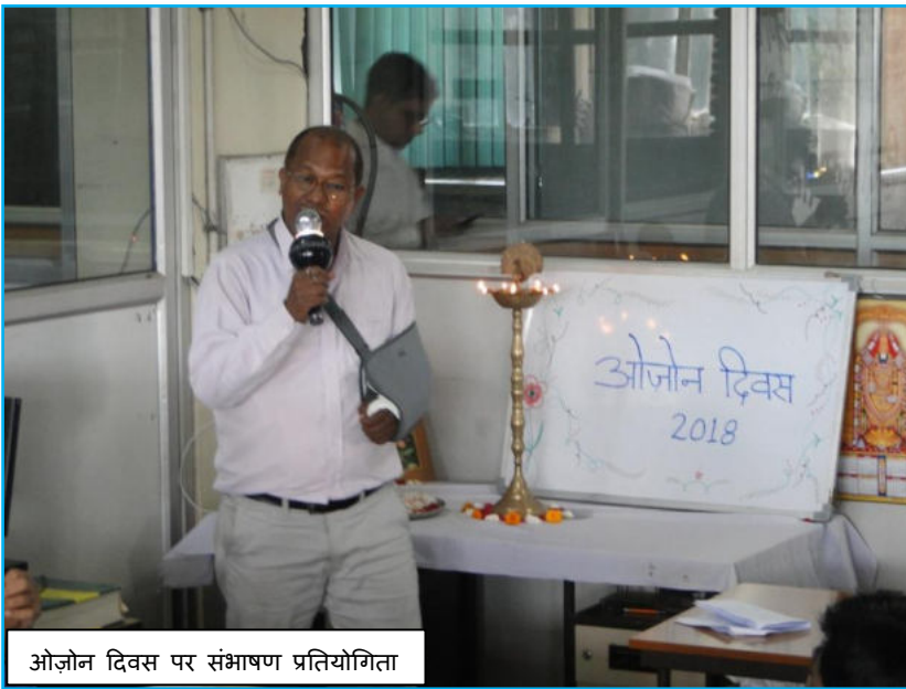
ओजोन दिवस पर संभाषण प्रतियोगिता