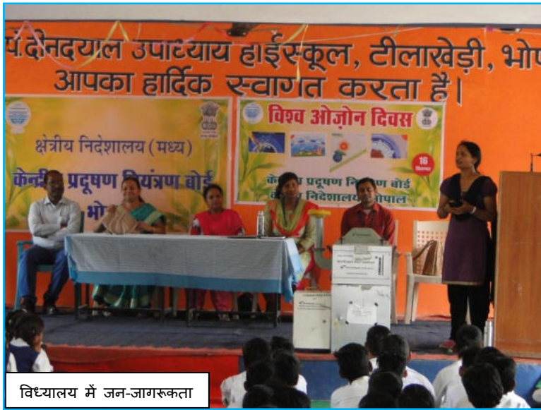
विध्यालय में जन-जागरूकता