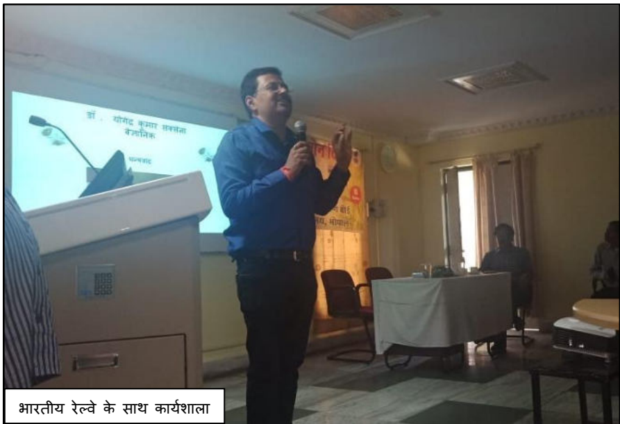
भारतीय रेल्वे के साथ कार्यशाला