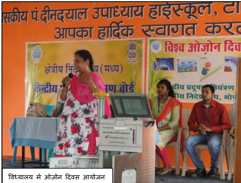
विध्यालय मे ओज़ोन दिवस आयोजन