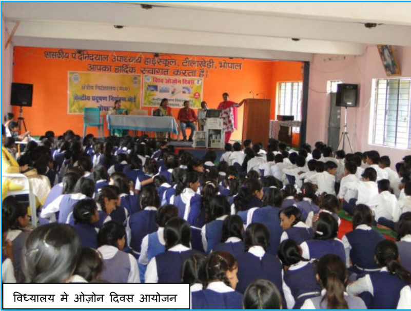
विद्यालय मे ओजोन दिवस आयोजन