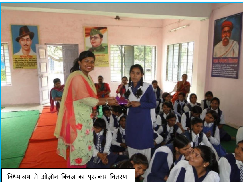
विद्यालय मे ओजोन विज का पुरस्कार वितरण