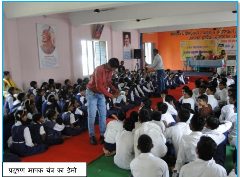
प्रदूषण मापक यंत्र का डेमो