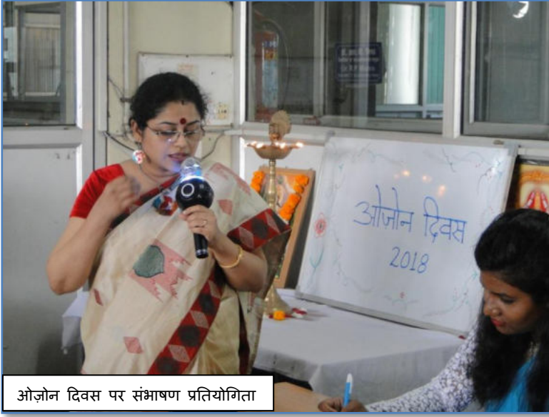
ओजोन दिवस पर संभाषण प्रतियोगिता