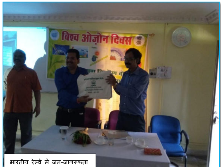
भारतीय रेल्वे में जन-जागरूकता