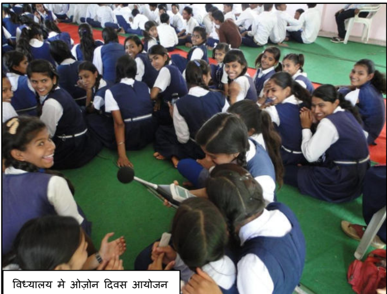
विध्यालय मे ओज़ोन दिवस आयोजन