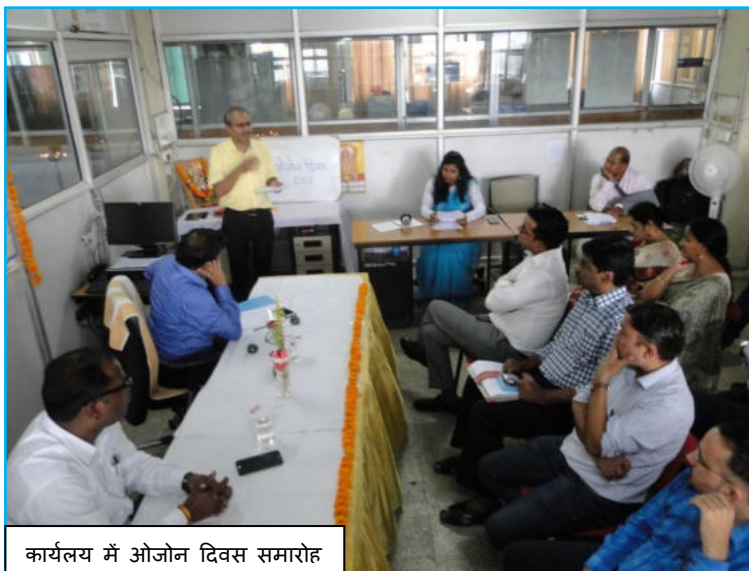
कार्यालय में ओजोन दिवस समारोह