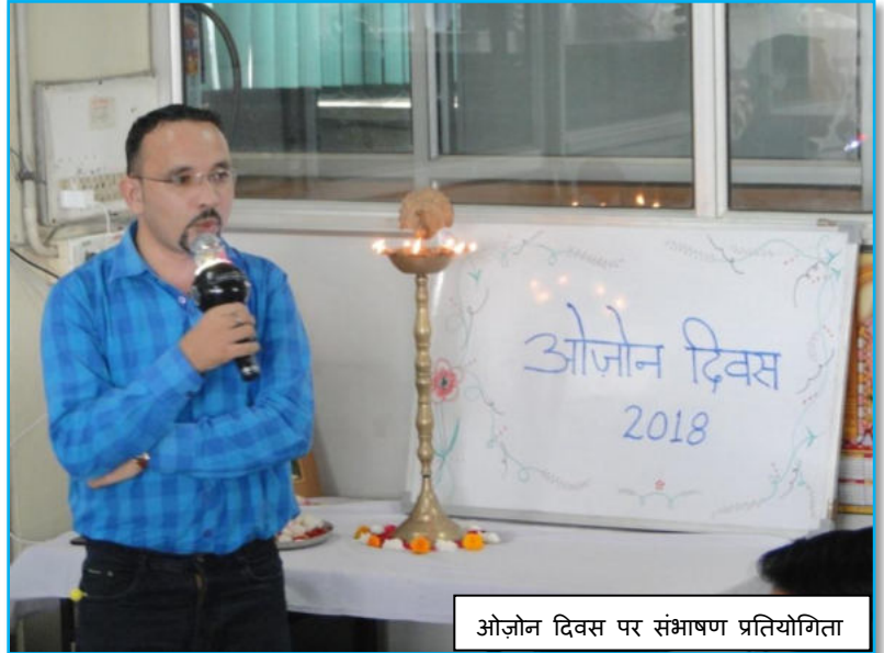
ओजोन दिवस पर संभाषण प्रतियोगिता