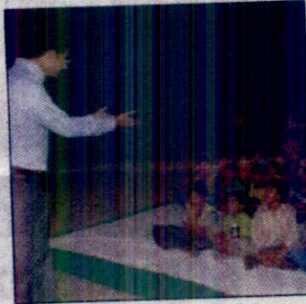
Children taking part in the quiz competition.

Ahead of this, an awareness programme was organised wherein the people were informed about the alternative resources of energy. Under the 'Dance for environment', the pub-